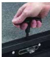
Drehraster, die weltweit für professionelle Bühnen verwendet werden, rasten Teile und Überbrückungen ein.