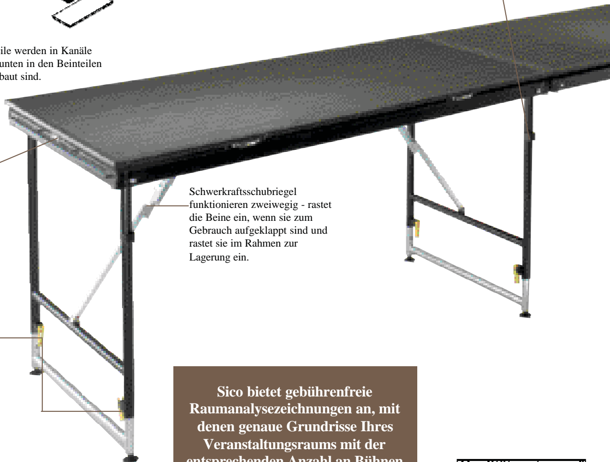
Schwerkraftsschubriegel funktionieren zweiwegig - rastet die Beine ein, wenn sie zum Gebrauch aufgeklappt sind und rastet sie im Rahmen zur Lagerung ein.

Sico bietet gebührenfreie Raumanalysezeichnungen an, mit denen genaue Grundrisse Ihres Veranstaltungsraums mit der entsprechenden Anzahl an Bühnen und Bühnenzubehör veranschaulicht werden können.